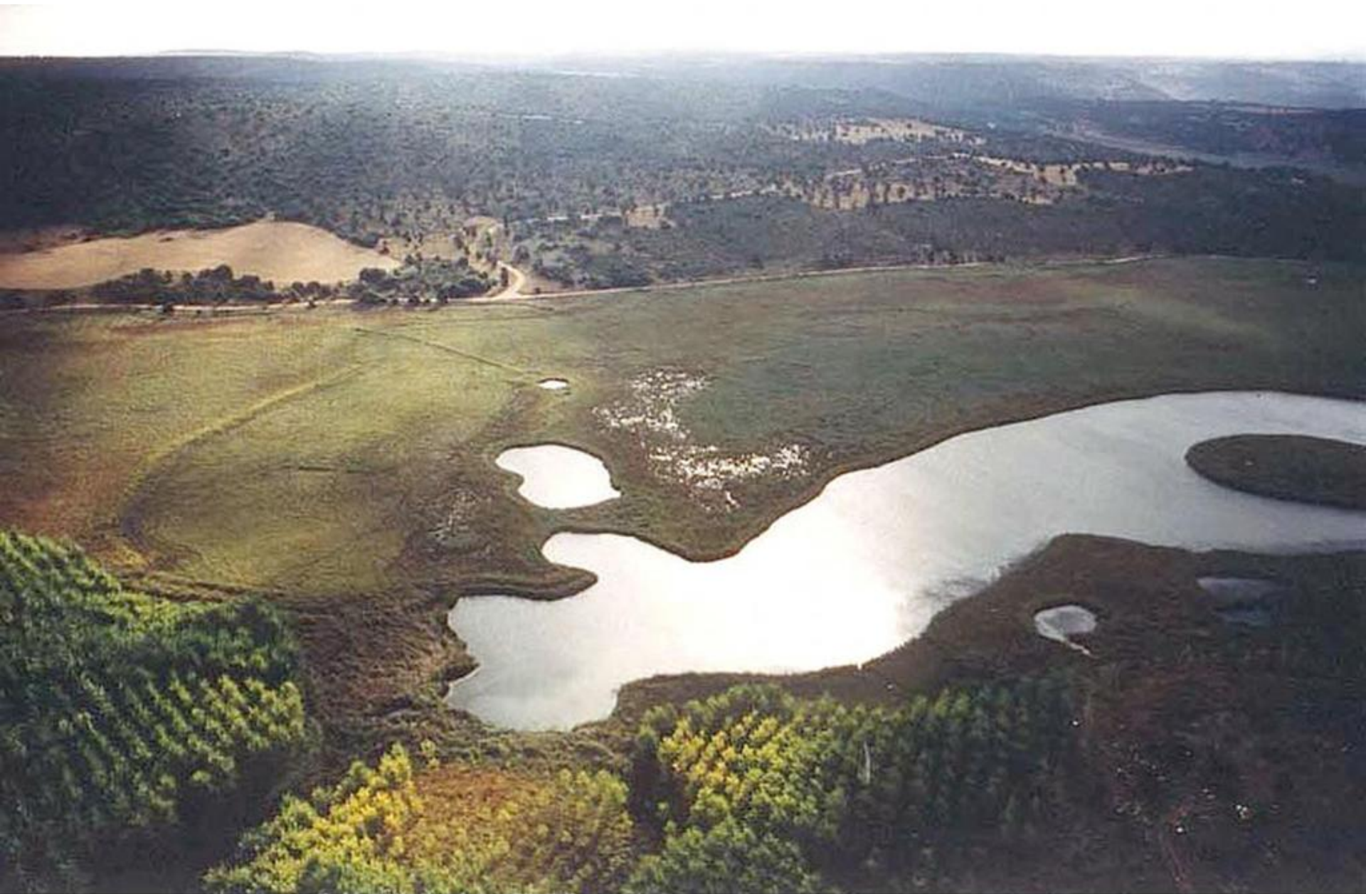
LAGUNA DE LOS OJOS DE VILLAVERDE