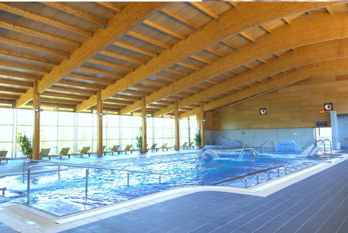
BALNEARIO DE BENITO