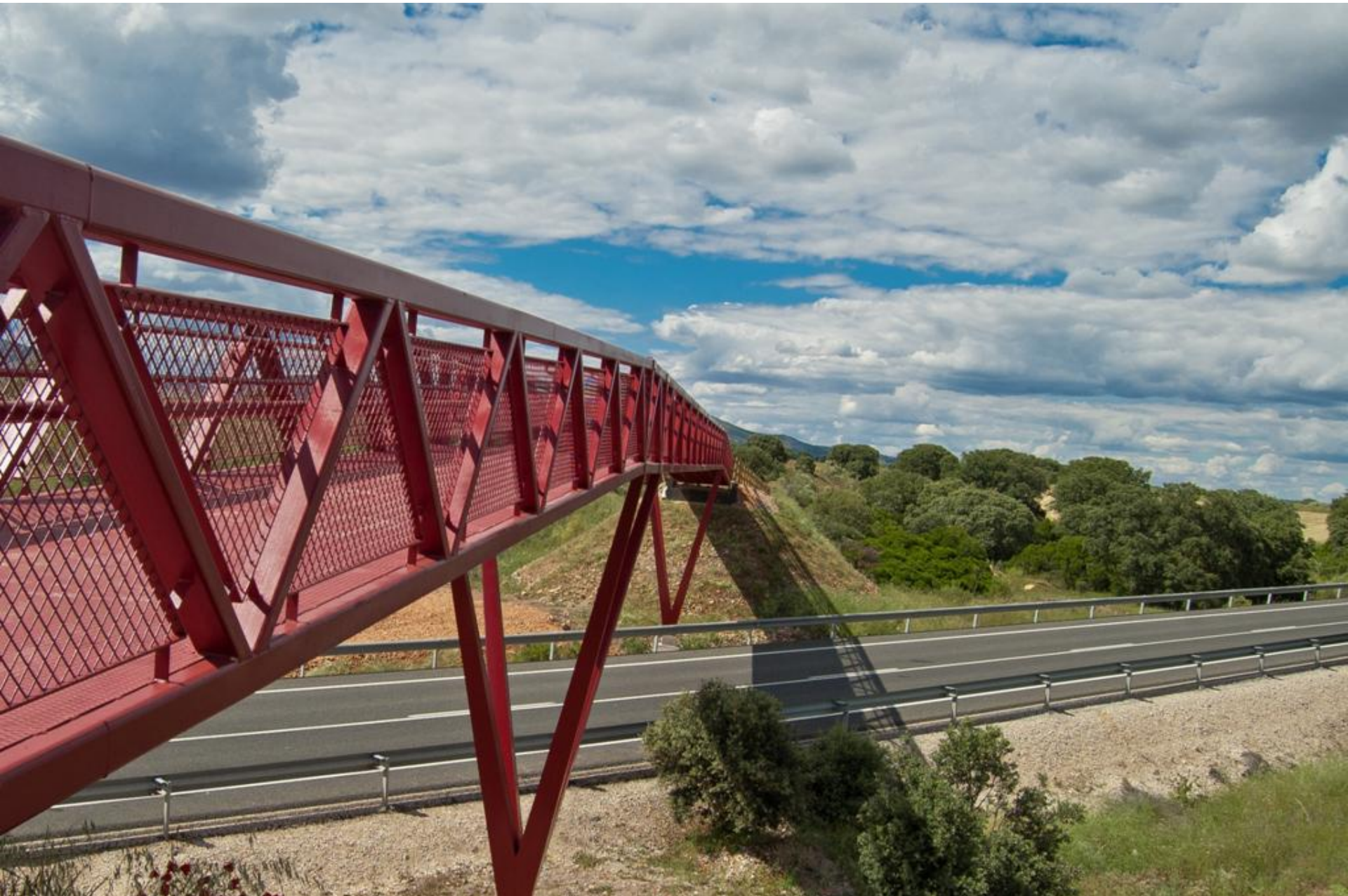
VILLAPALACIOS, Pasarela del Camino Natural Vía Verde Sierra de Alcaraz