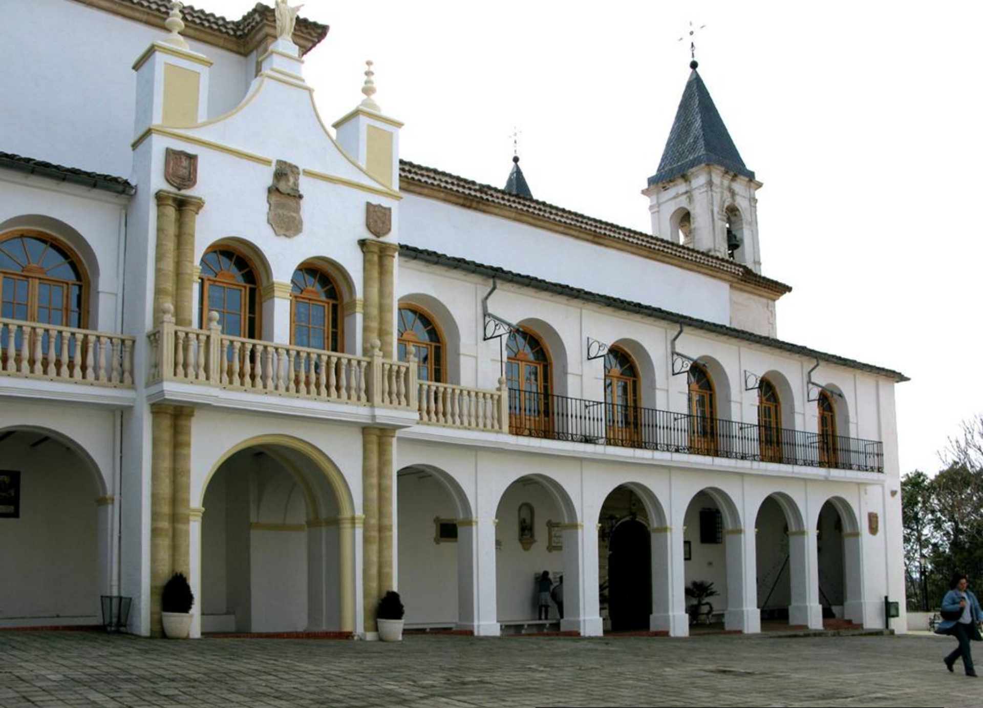
SANTUARIO NUESTRA SEÑORA DE CORTES