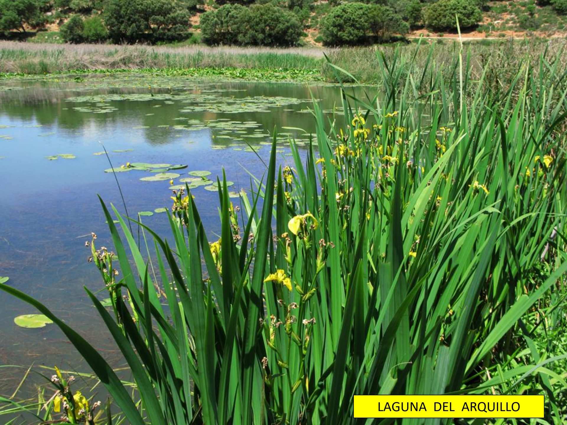
LAGUNA DEL ARQUILLO