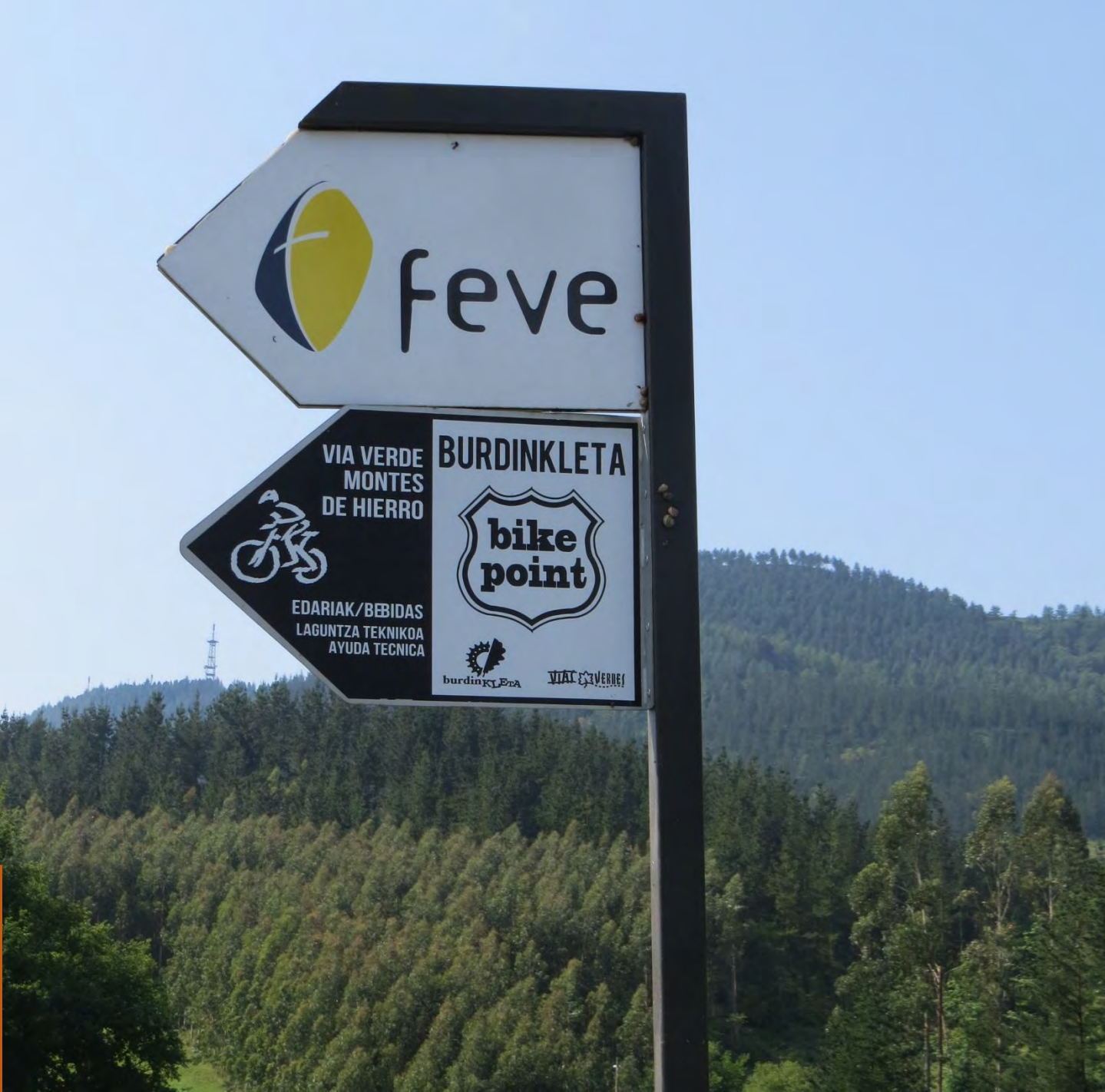
Generando oportunidades en territorios que habían perdido la esperanza con la pérdida del tren