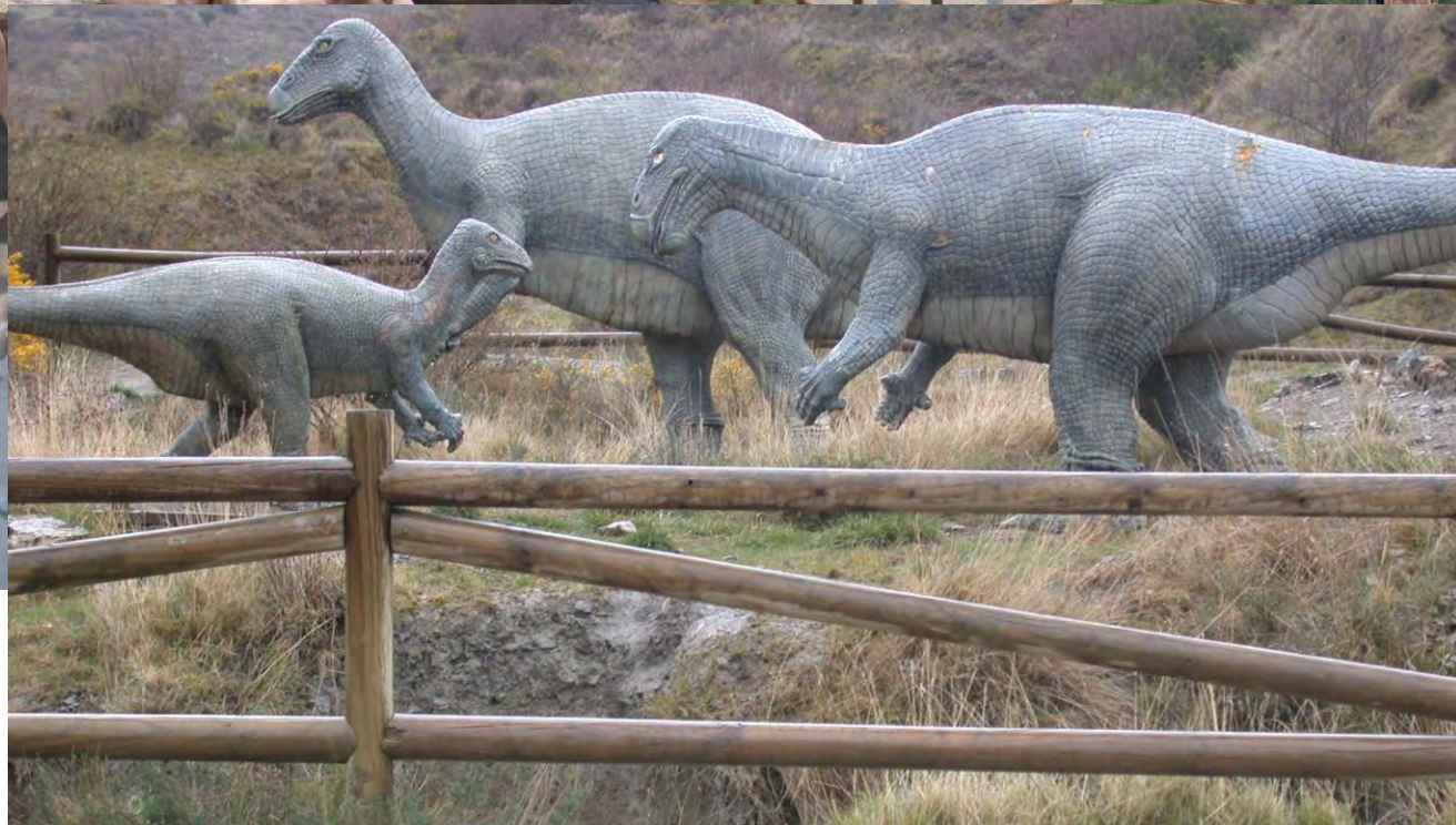
Las Vías Verdes nos ofrecen un camino fascinante para introducirnos en el territorio, en el paisaje