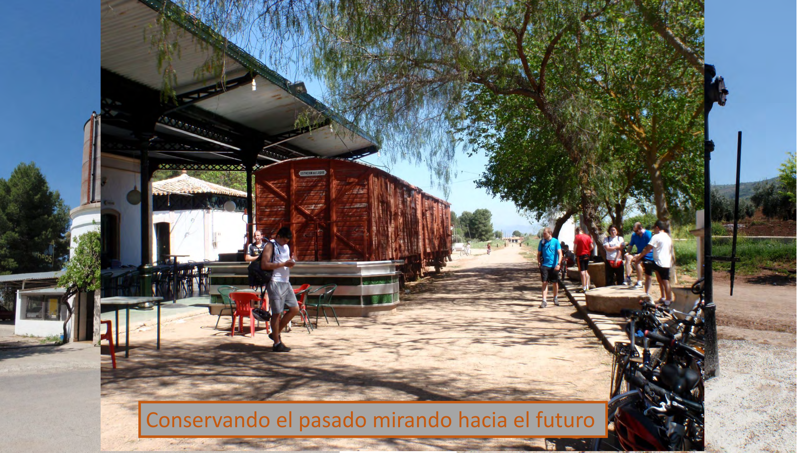
Conservando el pasado mirando hacia el futuro