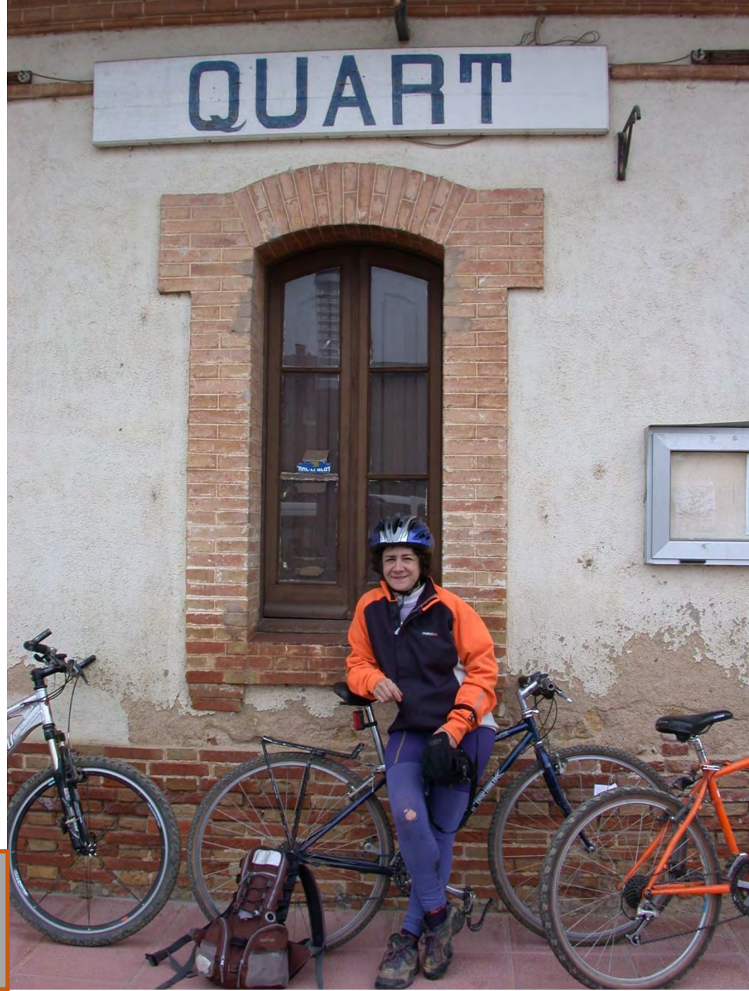
Muy pronto entendimos que a mucha gente le gustaba la propuesta