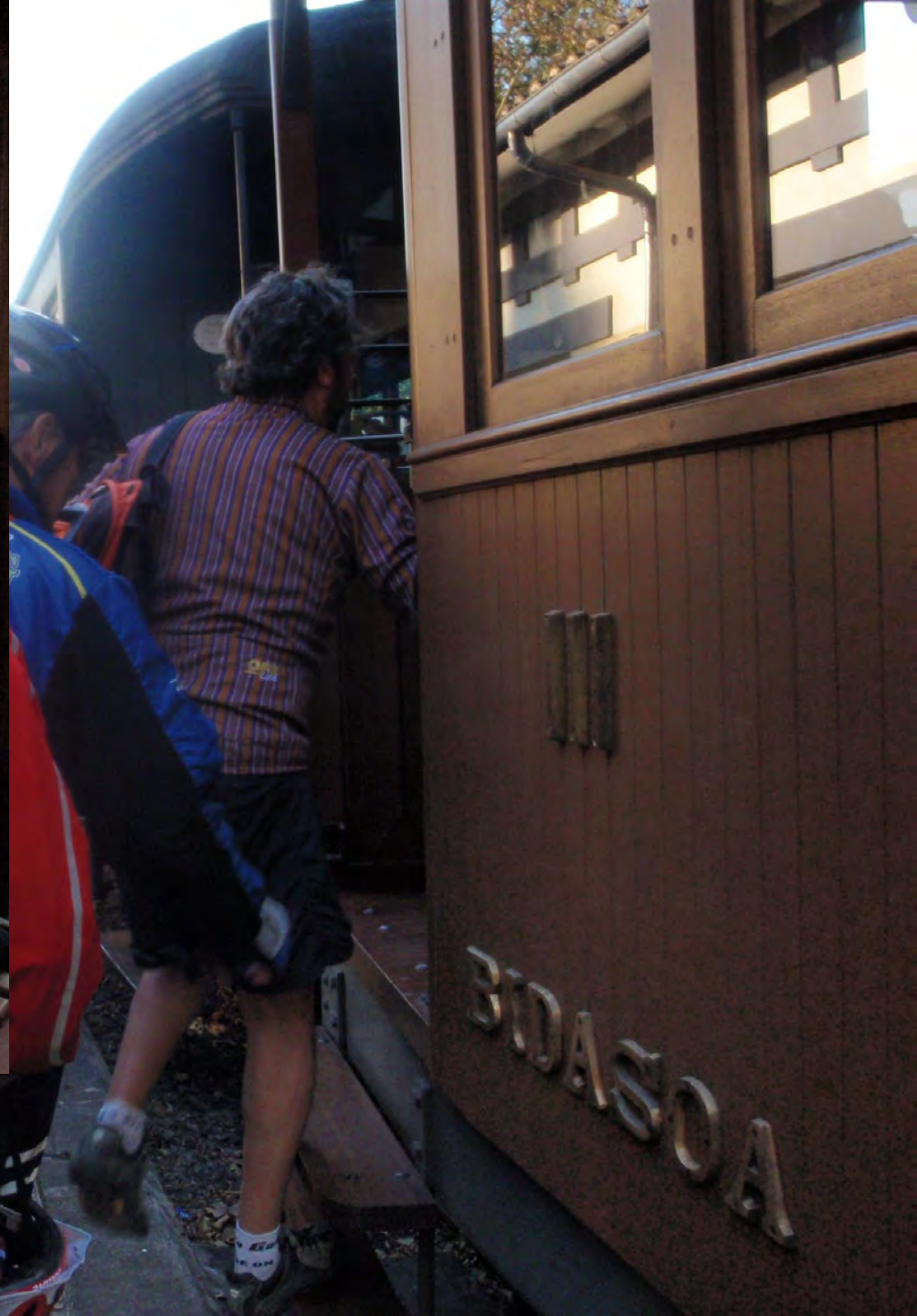
Únicos, incluyendo “nuestra historia”