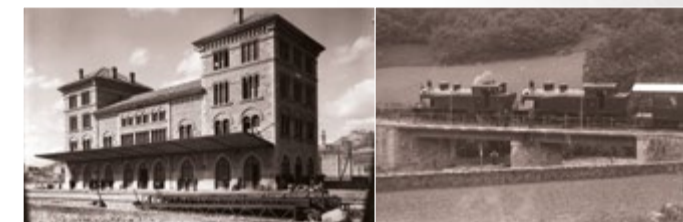
Lizarrako geltokia Estación de Estella Vasco Navarro trenbideko zubia Puente del Vasco Navarro

Antiguas estaciones, apeaderos, túneles y puentes conforman un magnífico patrimonio cultural e industrial que, gracias a la recuperación del antiguo trazado del Vasco Navarro, podemos conocer, interpretar y valorar. Recorrer la Vía Verde del Vasco-Navarro permite tomar conciencia de la importancia y significación que tuvo esta infraestructura, desde su inauguración allá por 1889, ayudando a la vertebración y el desarrollo social y económico de las comarcas que atraviesa. Hoy en día, y gracias a la reconversión de la plataforma como Vía Verde, y con unos usos ludicos y turísticos, el Vasco Navarro continúa permitiendo el descubrimiento de paisajes, lugares y personas, y favoreciendo el desarrollo económico del territorio, desde una perspectiva local y sostenible.