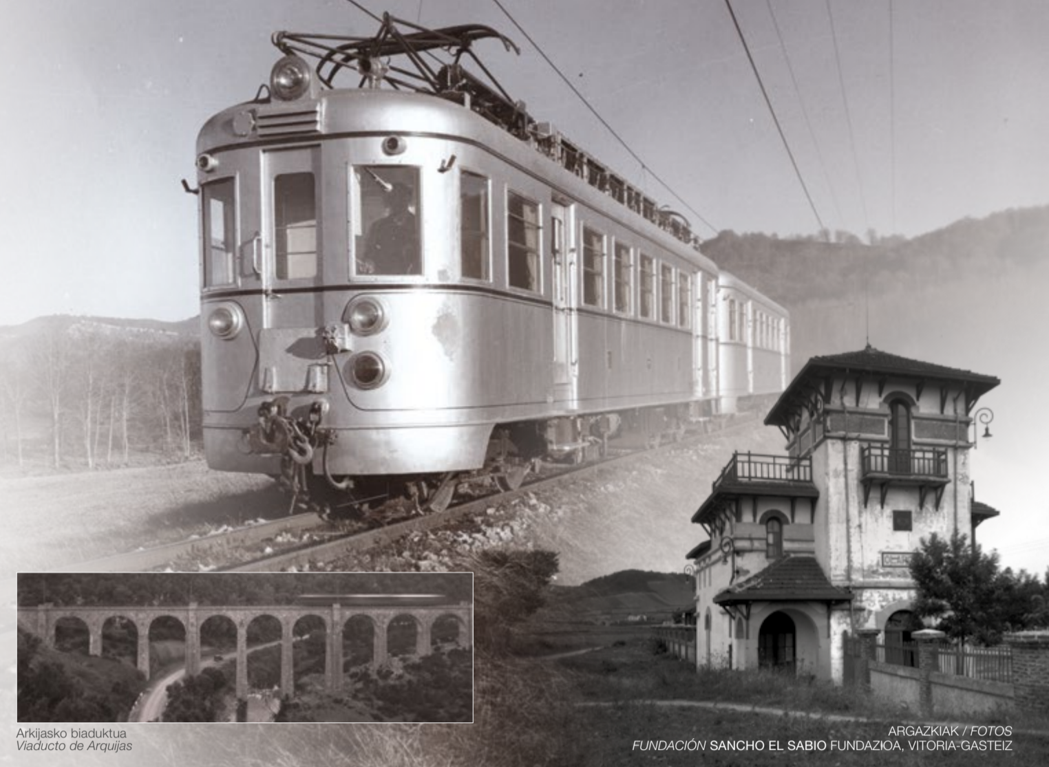
Arkijasko biaduktua Viaducto de Arquias